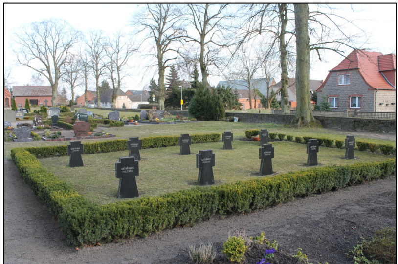
Auf einer Kriegsgräberstätte sind 19 deutsche Soldaten bestattet, darunter 12 unbekannte